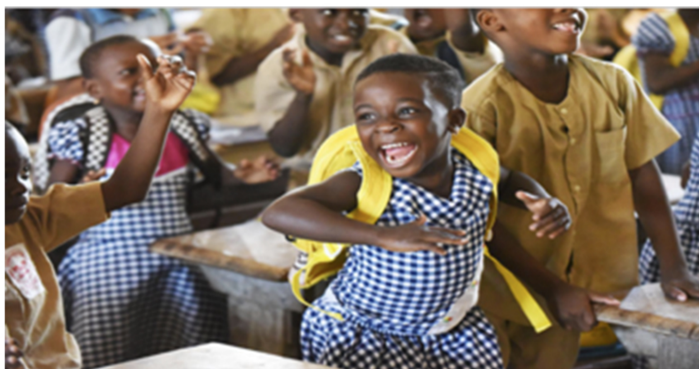
▲ Elèves en Côte d'Ivoire